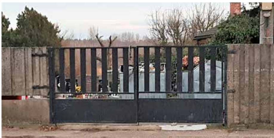
Plot cintorína pred výmenou.

Rozširovanie kapacity materskej školy je nekonečnou pesničkou, ktorú, dúfam, dohráme tento rok. Počíta sa so získaním dotácie vo výške 230 000 eur a sumou 70 000 eur z rozpočtu obce. Časté víchrice sa podpísali pod stav strechy na škôlke, ktorá si bude vyžadovať opravu. Vlni sa zrekonštruovali jej vnútorné priestory – kuchynka stála 20 640 eur z vlastných finančných prostriedkov a modernizácia spojená s výmenou kuchynského zariadenia si vyžiadala