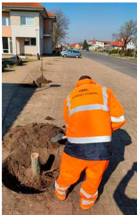
Odstránili sme stromčeky pred obecným úradom.