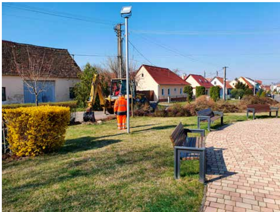
Za pomoc pri vytrhaní kríkov ďakujeme aj firme FirstFarms.