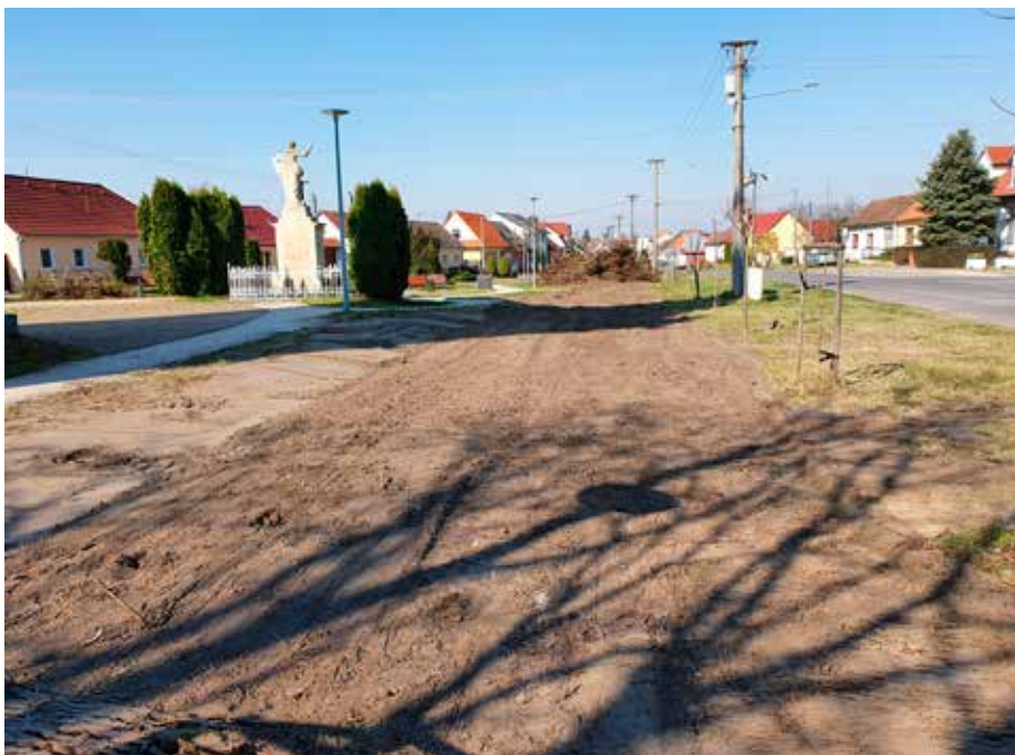
Vyrovnávanie terénu po odstránení kríkov.

Veľa projektov vieme uskutočniť len vďaka finančnej podpore a sponzoringu spoločnosti Nafta, Nadácie EPH, spoločnosti FirstFarms Agra M a rôznym výzvam na získanie finančných prostriedkov. Ďakujem spoločnostiam ako