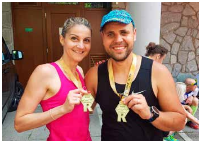
Soňa s manželom.