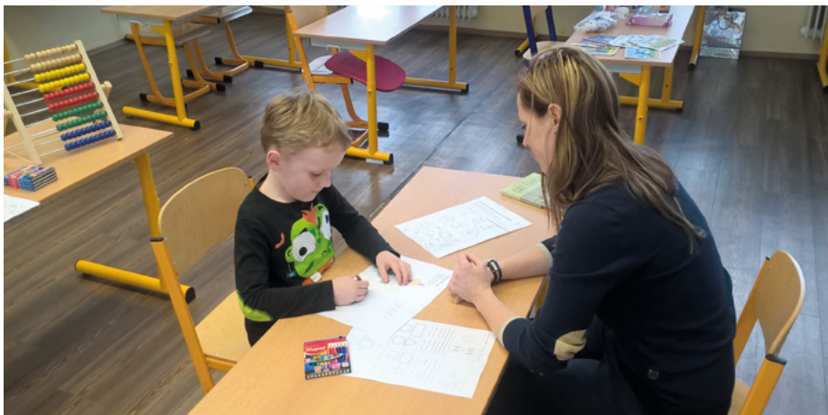
Zápis do školy v roku 2018.