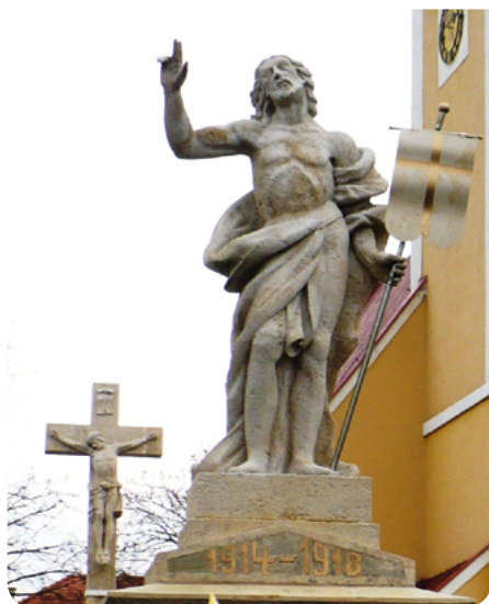
Socha zmŕtvychvstalého Krista – víťaza nad smrťou.

Na svete je mnoho náboženstiev. V každom z nich sa tvrdí, že je to pravé. Ak by chcel človek všetky spoznať, musel by hádam celý svoj život venovať štúdiu týchto náboženstiev a náboženských spoločností. Prečo? Aby sa azda na konci svojho života pre nejaké rozhodol.