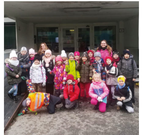
Návšteva Bratislavského bábkového divadla.