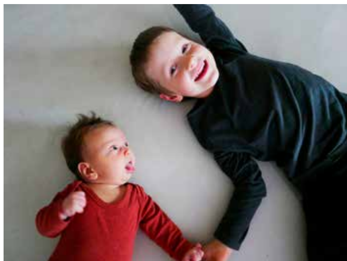
Ninko s bratom.