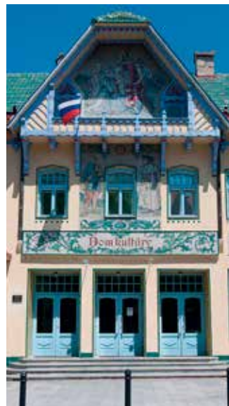
Secesný dom kultúry.