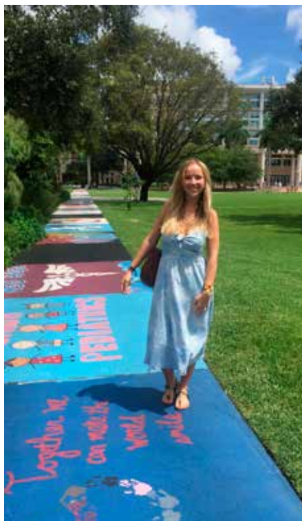
Univerzita na Floride.

jedlo. Ako v Španielsku, tak aj v Taliansku, čo by ste asi neočakávali a možno som jediná na svete, ale žiť na pizzu a cestovinách nie je nič pre mňa. Z talianskych jedál však milujem napríklad ich syry, šunky a výborne vedú pripraviť aj rybu či zeleninové jedlá. V španielskej kuchyni mi chýbala zelenina a ovocie. V oboch krajinách mi zároveň chýbali slovenské stravovacie návyky, pokiaľ ide o čas. Južania radi večerajú vcelku neskoro a raňajkujú málo, ak vôbec. Ja som zvyknutá na úplný opak. Samozrejme, aj v tomto období mi chýbala moja rodina. Je to fajn, žiť si tak slobodne a sám, ale predsa len je to iné, keď