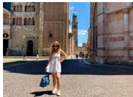
V talianskom meste Parma.

rozmyslia, či povedať na ich krajinu niečo negatívne. Myslím, že nám na Slovensku toto trošku chýba. Je mi to aj ľúto, lebo čím viac vidím zo zahraničia, tým viac si uvedomujem, že my sa určite nemáme za čo hanbiť, že podmienky na podnikanie a uplatnenie sa u nás vôbec nie sú zlé. Taktiež úroveň vzdelania a všeobecný prehľad o svete sú u nás naozaj dobré. Verím, že táto a ďalšie generácie využijú potenciál Slovenska, nebudú utekať preč a podarí sa nám vybudovať si väčšie a silnejšie národné povedomie. Okrem tohto je rozdiel v tom, že Taliani akosi viac berú život tak, ako príde. Asi to bude aj ich nárokmi, ktoré sú vysoké, pokiaľ ide o jedlo, ale zase nepotrebujú mať hrbu oblečenia, najviac tip-top uprataný dom, veľkú záhradu, značky a celkovo si nepotrpia až tak na to, čo si o nich pomyslia susedia či ľudia na ulici, nepotrebujú sa ukazovať. Stačí im málo, ale kvalitných vecí, spoločnosť blízkych a priateľov, spoločné obedy/večere a espresso, čo do seba rýchlo „na stojáka“ šupnú a utekajú si ďalej po svojom.