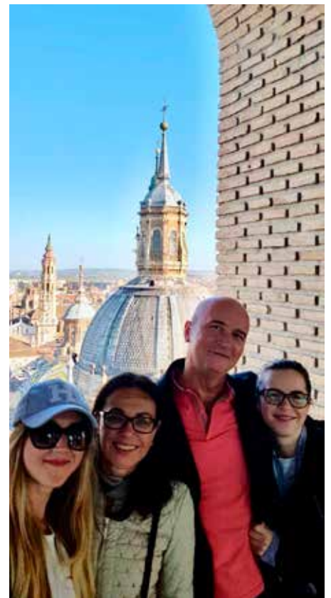
S rodinou v španielskej Zaragoze.

ste niekde, kde nemáte svoje zázemie. Môžete mať priateľov, koľko chcete, ale nakoniec je to práve vaša najbližšia rodina, čo je pri vás vždy a podrží vás v každej situácii.