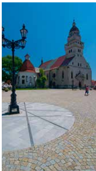
Kostol sv. Michala.