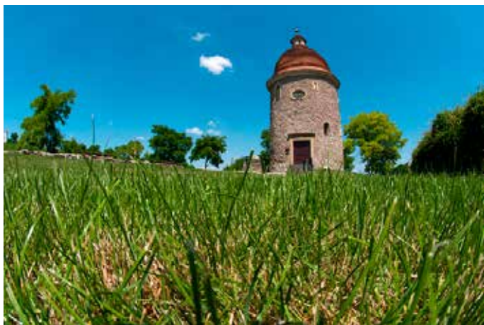
Rotunda sv. Juraja.