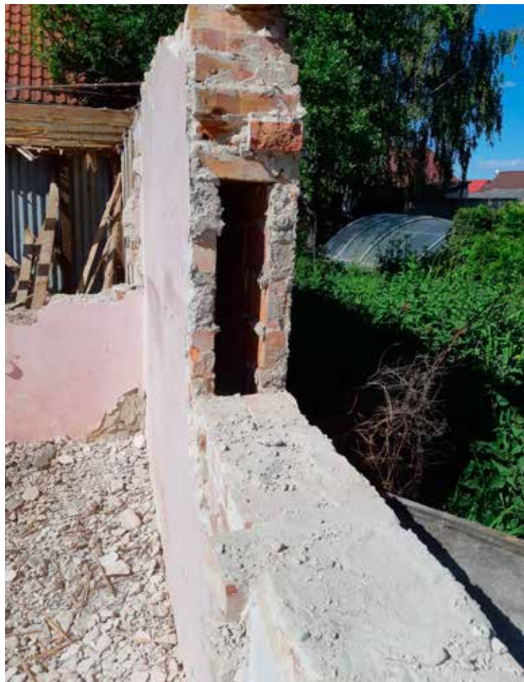
Stena, v ktorej boli uložené odkazy.