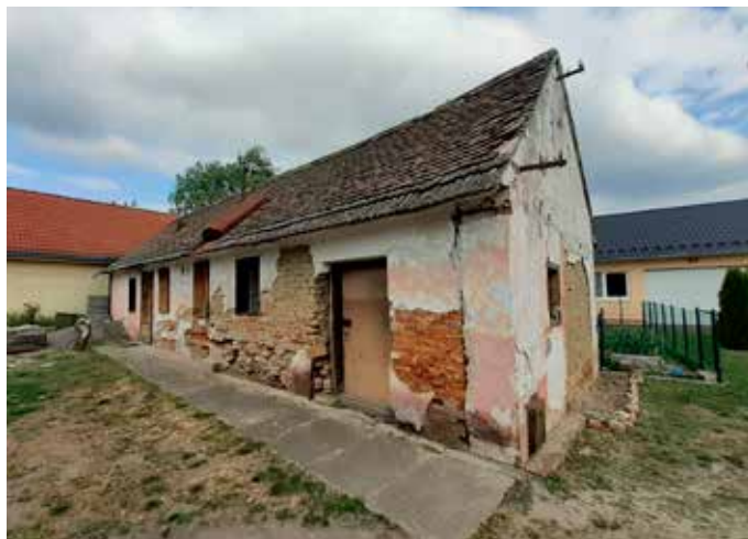
Dom v pôvodnom stave.

Zbraň, ktorú našli spolu s odkazmi, odniesli noví majitelia na políciu. Podľa odhadov je z roku 1860 a po vrátení z polície majú v pláne odovzdať ju do múzea.