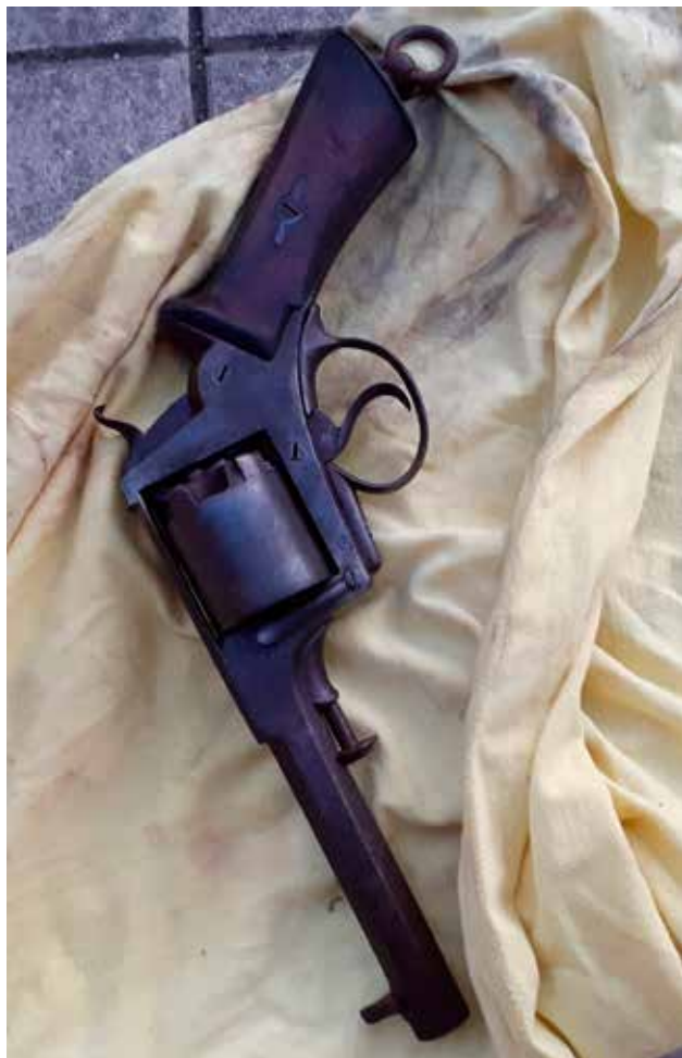
Zbraň z roku 1860.